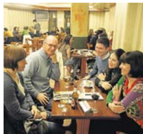
Una polaca, una jordana y españoles. J.V.

Los participantes se organizan por parejas según el nivel